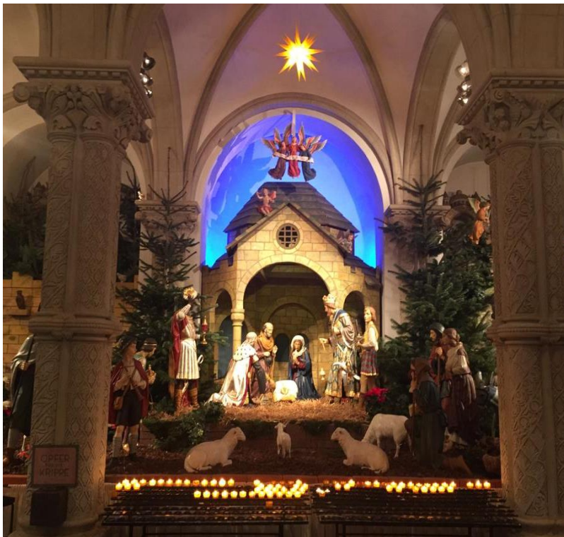
Krippe im Dom zu Osnabrück